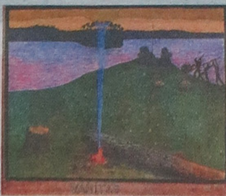
Tarvaspään näyttelyssä on esillä myös luonnos teokseen Vanitas (Kristinusko ja pakanaisuus) vuodelta 1900.